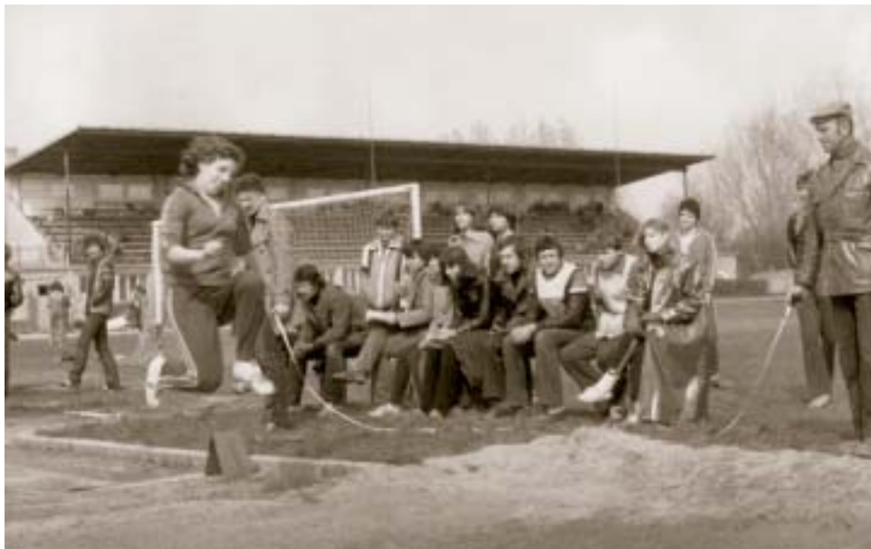
▲ Súťaž v ľabkej atletike