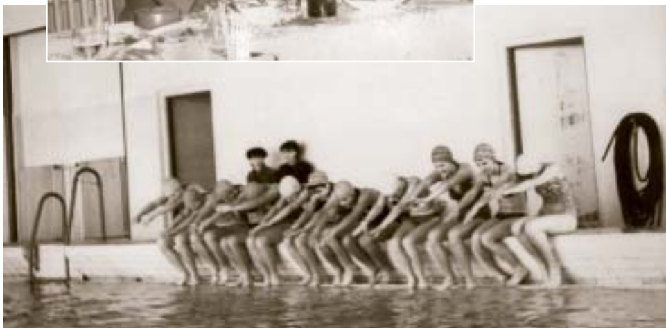
▲ Plavecká súťaž