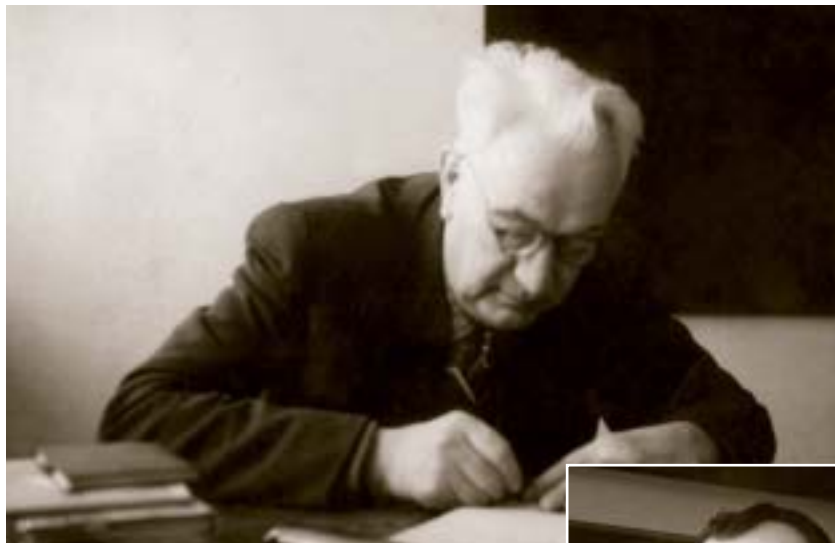
Bývalý pedagóg školy J. Kapinay