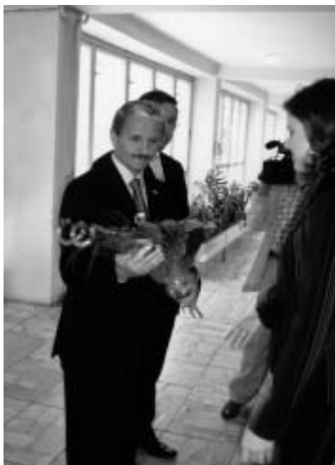
Premiér M. Dzurinda nás poctil svojou návštevou