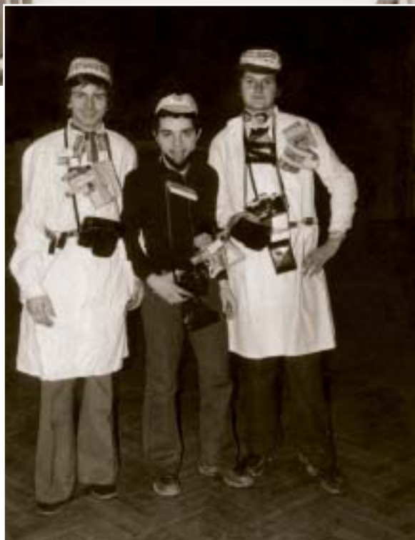
▲ Stužková slávnosť v OSP Galanta