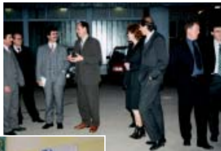
▲ Z rozlúčky s ministrom školstva