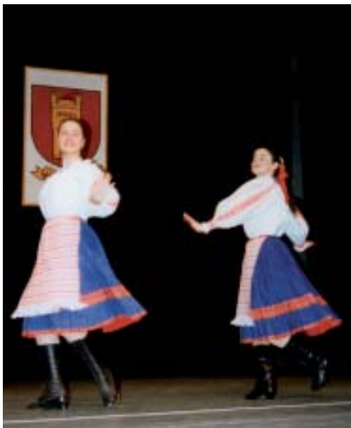
Tanečné vystúpenie našich žiakov ▲