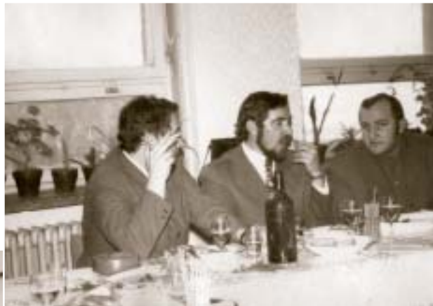
◀ Oslavy životného jubilea