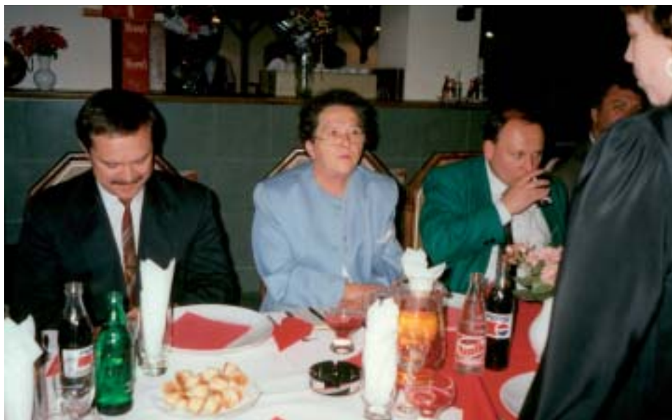
Pomaturitné stretnutie ▲