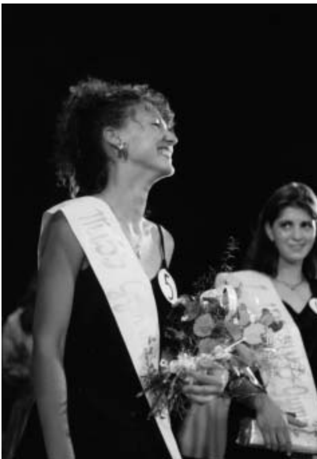
▲ Víťazka súťaže Miss gymnázium