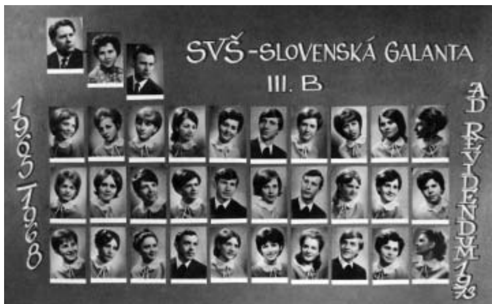
▲ Maturitné tablo

Počas tohto obdobia prešla naša škola mnohými zmenami vyvolanými rôznym smerovaním spoločnosti. Okrem už uvedených míľnikov to v ostatnej histórii bolo najmä vyprofilovanie foriem štúdia. Popri štvorročnom štúdiu, ktoré je určené pre absolventov ZŠ a je organizované podľa učebného plánu so všeobecným zameraním, sme v školskom roku 1991/1992 otvorili i osemročnú formu štúdia so zameraním na biológiu a chémiu. Daný typ štúdia umožňuje nadaným žiakom už po ukončení štvrtého ročníka základnej školy a po úspešnom zvládnutí prijímacích skúšok študovať na škole, ktorá im poskytne úplné všeobecné stredné vzdelanie. Uvedené zameranie však umožňuje dosiahnuť potrebný vedomostný štandard aj v ostatných spoločensko-vedných a prírodovedných predmetoch a absolventi tak môžu študovať na ktorejkoľvek vysokej škole, či uplatniť sa úspešne v praxi. Študenti štvorročného i osemročného typu štúdia majú možnosť vybrať si zo širokej ponuky seminárov a cvičení. Tieto im pomáhajú získať vedomosti potrebné pre úspešné vykonanie maturitnej skúšky i zvládnutie prijímacích skúšok na vysoké školy. V ponuke výučby cudzích jazykov je v súčasnosti na našej škole anglický jazyk, nemecký jazyk a ruský jazyk.