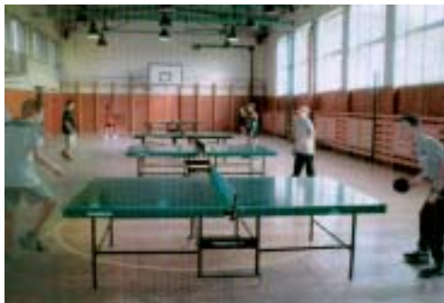
◀ Stolnotenisový turnaj