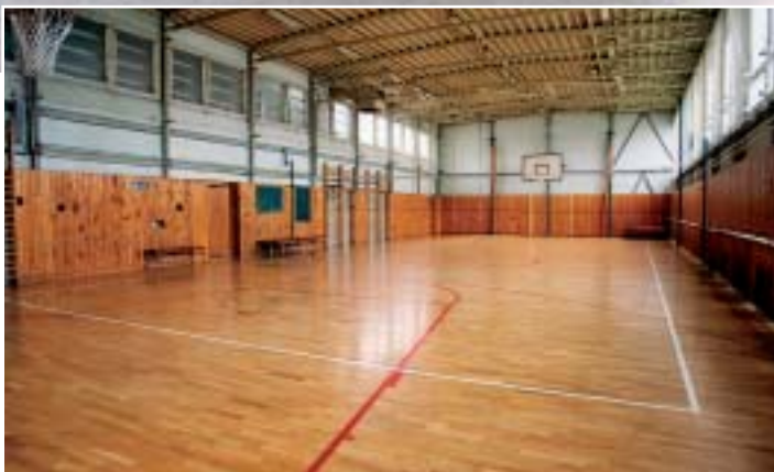
▲ Chodby našej školy