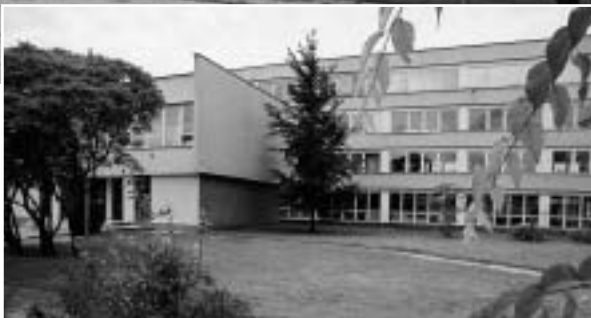
Pobľad na budovu súčasnej školy ▶