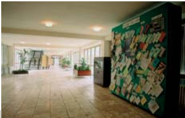
◀ Nástenka výchového poradcu