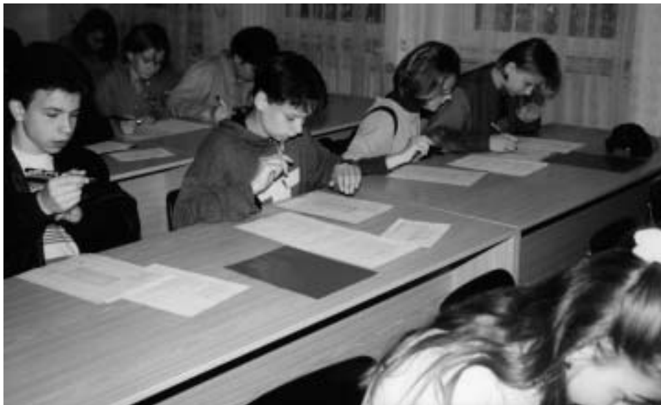
▲ Žiaci na hodine cudzieho jazyka