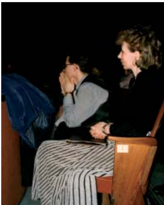
▶ Oslavy výročia školy