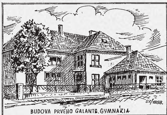
BUDOVA PRVEHO GALANTS. GYMNAZIA