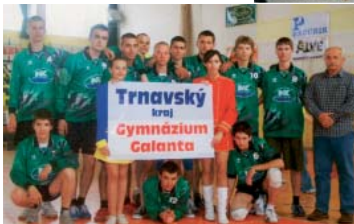
◀ Družstvo našich volejbalistov na Majstrovstvách Slovenska