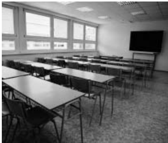
Naša trieda v novostavbe ▲

malých divadiel poézie cez Ludovú školu umenia Vitalit, v ktorej aktívne pôsobili. Členovia študentskej rady v spolupráci s vyučujúcimi slovenského jazyka vydávajú školský časopis „Občasák“.