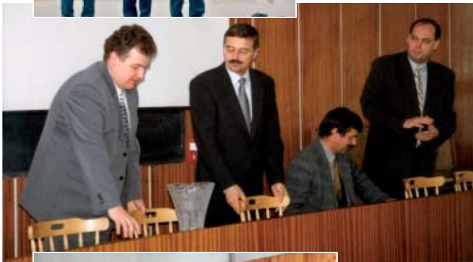
▲ Podpredseda vlády M. Hamžik na našej škole