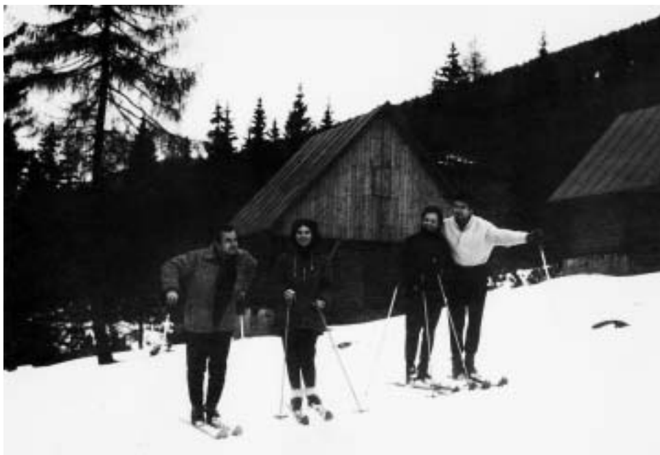
Na lyžiarskom kurze ▲

„Najkrásnejšie na svete nie sú veci, ale chvíle, okamihy, minúty...“