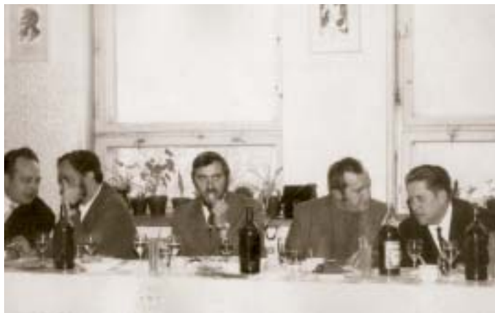
◀ Spoločenské posedenie