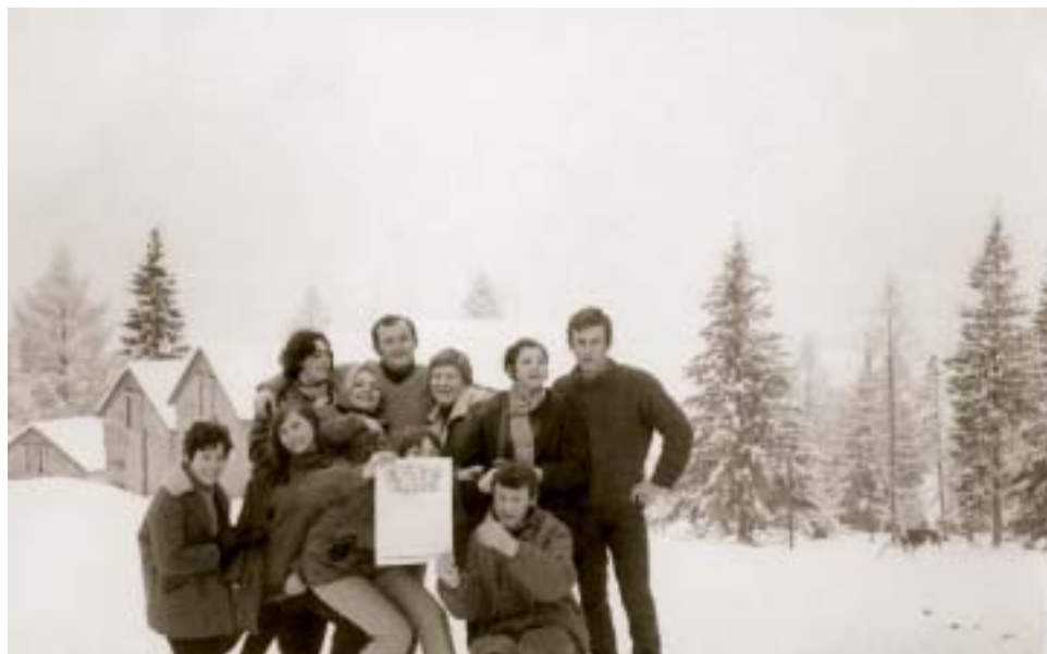
Zimné radovánky študentov ▲