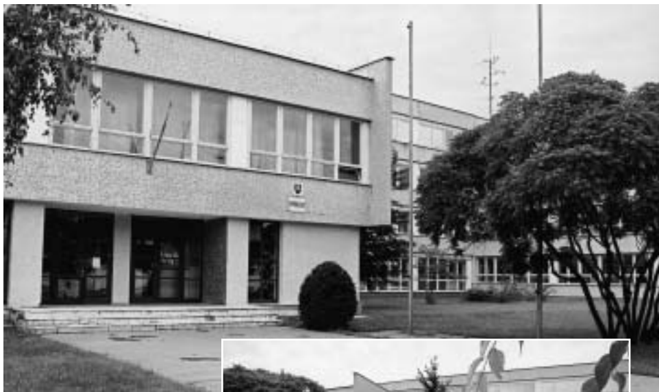
Vchod do budovy gymnázia ▲