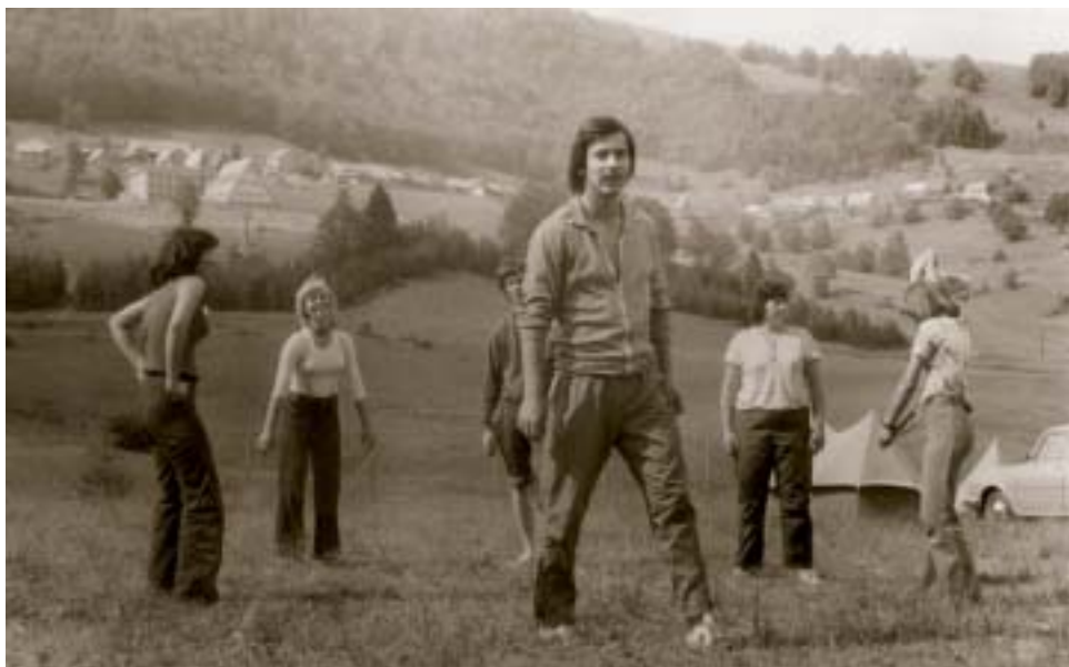
▲ Na školskom výlete