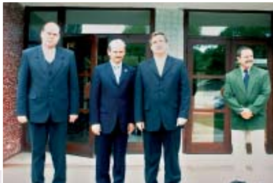
◀ Vzácni hostia – máj 2005