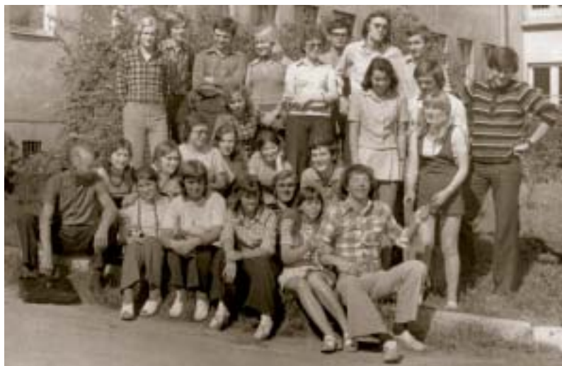
Fotografia triedy na konci školského roka .....