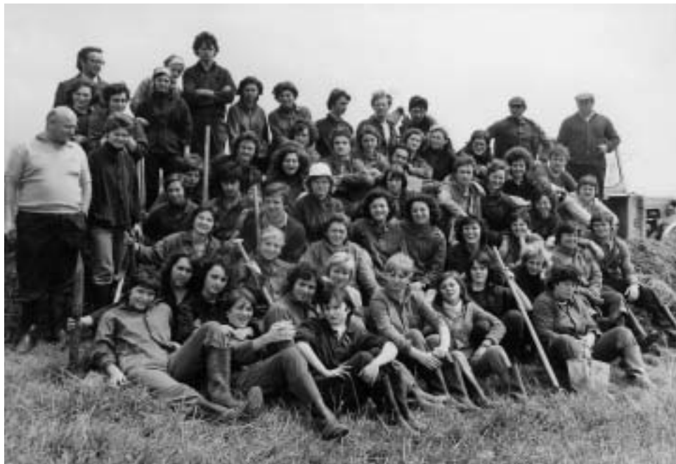
Spomienka na brigádu ▲