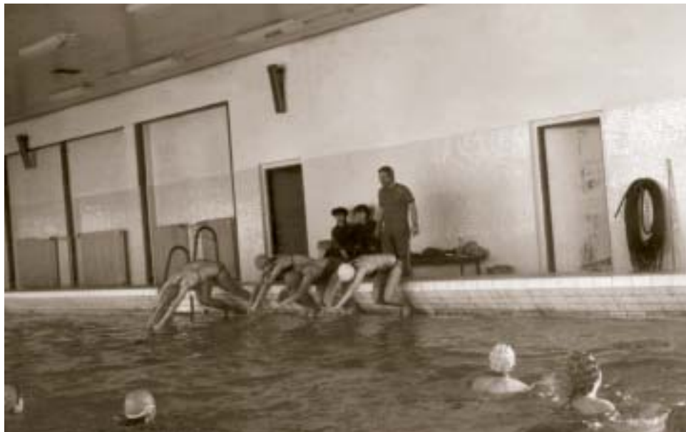
▲ Hodina telocviku v plavárni