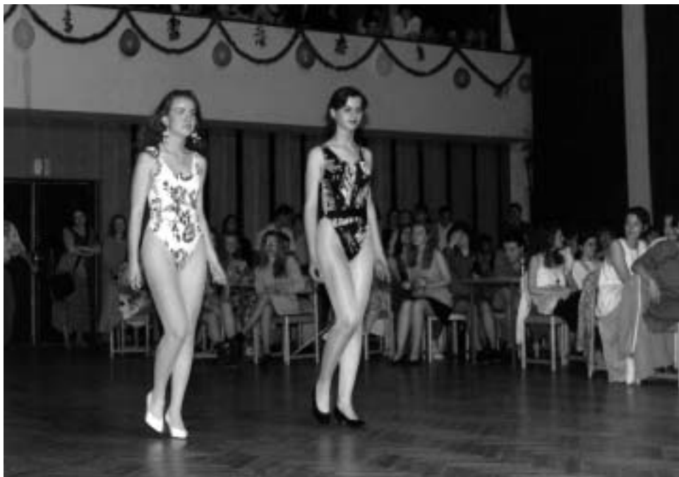
▲ Volba miss