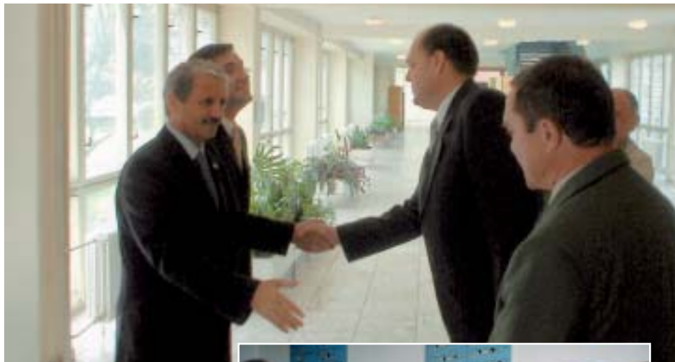
Z návštevy predsedu Vlády SR