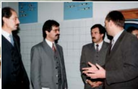
Návšteva ministra školstva