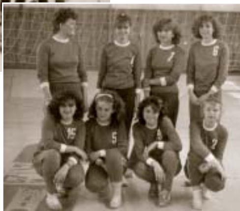
Reprezentantky školy vo volejbale