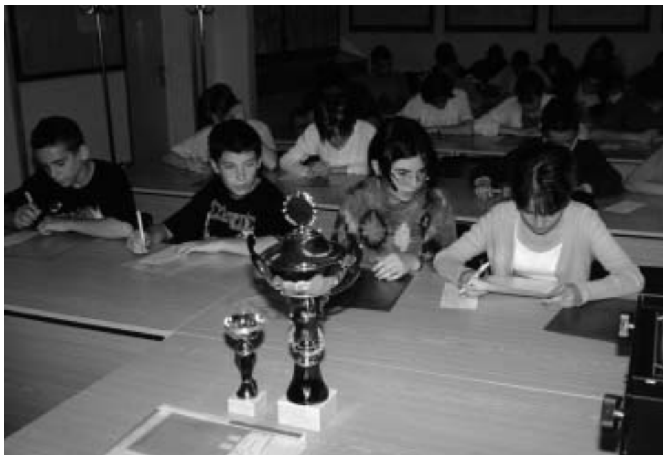
Žiacka súťaž ▲