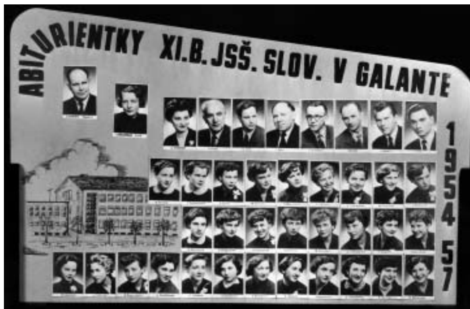
Jedno z najstarších maturitných tabiel ▲

Za 60 rokov existencie galantského gymnázia sa na jeho čele vystriedalo sedem riaditeľov.