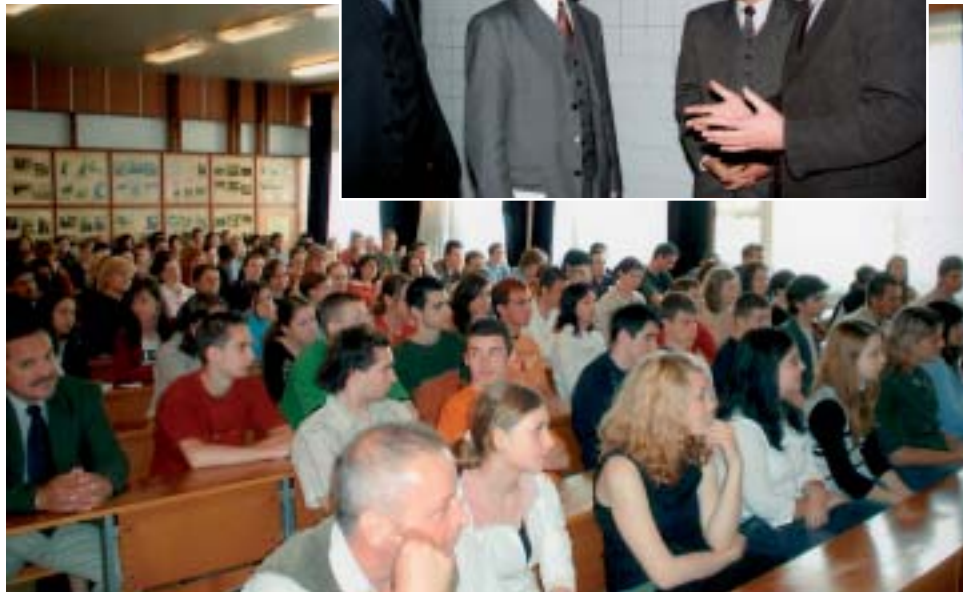
Školská beseda v aule