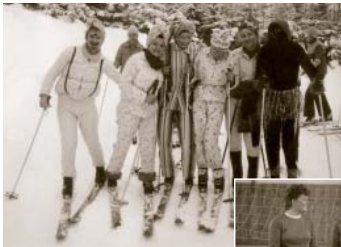
Maškarný ples na lyžiach