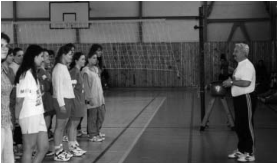
▲ Na hodine telesnej výchovy