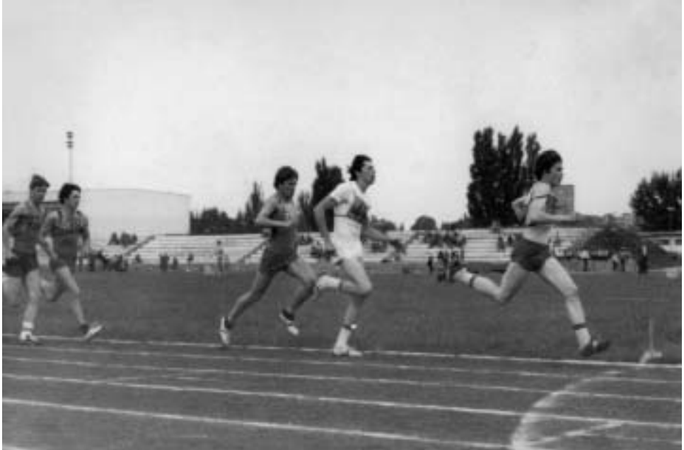
▲ Športové zápolenie študentov