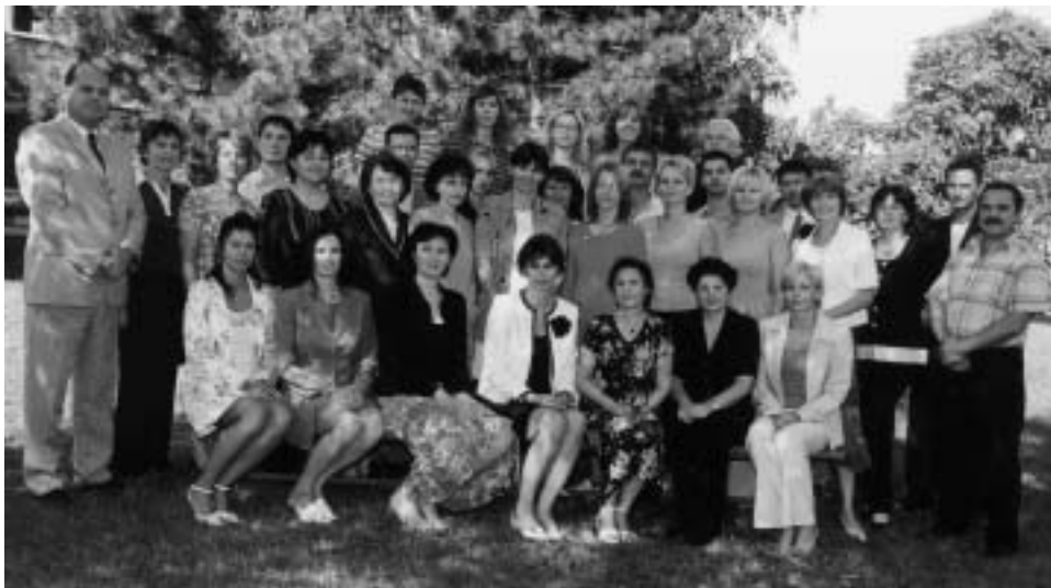
▲ Pedagogický zbor Gymnázia Janka Matúšku Galanta