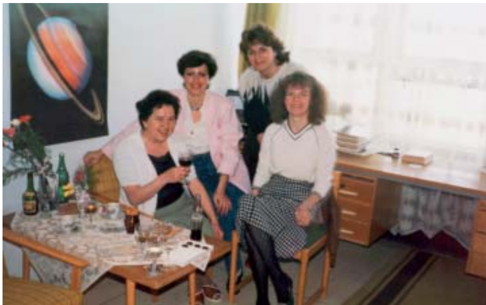
▲ Počas prestávky