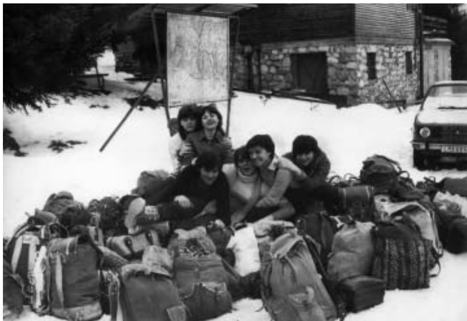
Začiatok lyžiarskeho kurzu ▲

Práve preto sa na okamih pozastavme a aspoň v duchu poprajme k výročiu našej školy všetko najlepšie. Bodaj by tu stála ešte celé desaťročia vo svojej krásnej majestátnosti a vážnosti, snád si aspoň v tieto dni uvedomíme, aká je pre nás vzácna a nenahraditeľná.