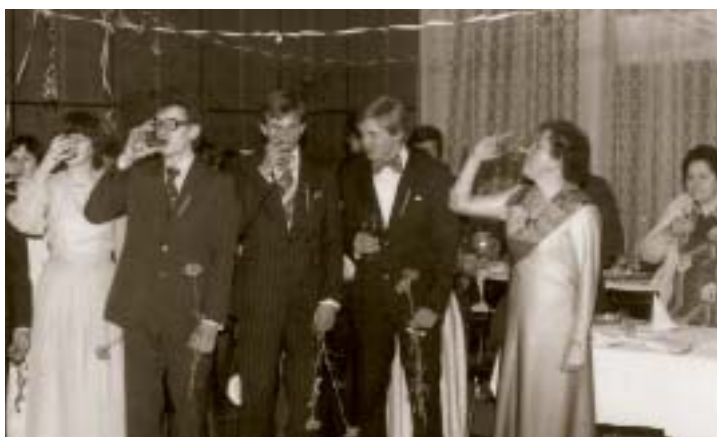
◀ Okamih zo slávnosti zo ťažkovej slávnosti