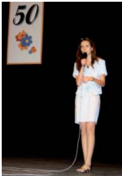
75 Oslavy 50. výročia gymnázia ▲