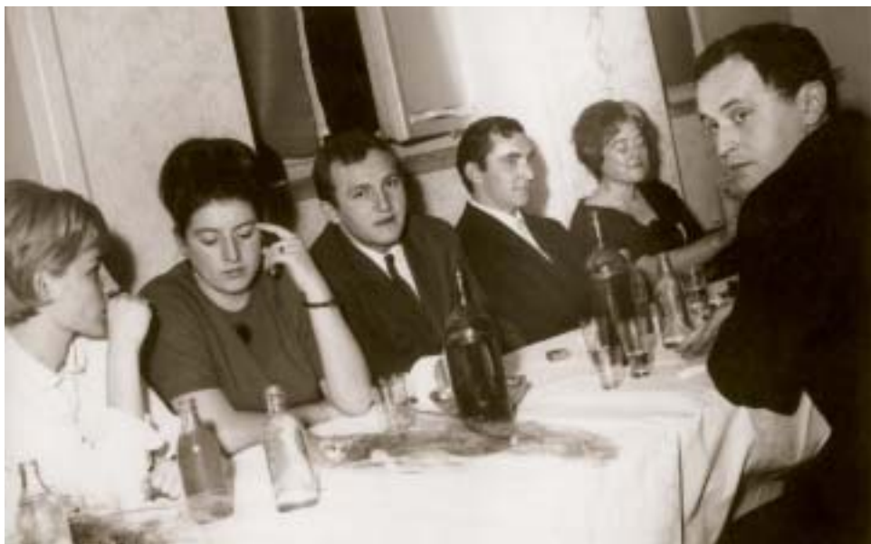
▲ Stužková slávnosť