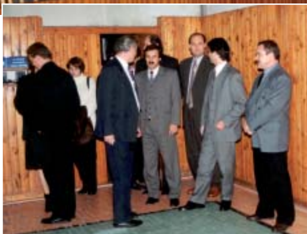
◀ Minister školstva pri prebliadke telocvične