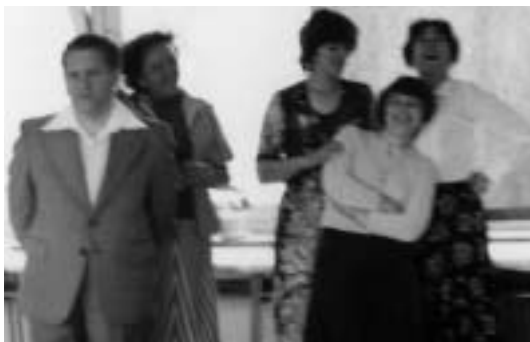
▲ Chvilke pobody a uvoľnenia

Z mojich 49 rokov pôsobenia v školských službách patrilo 23 galantskému gymnáziu vo funkcii riaditeľa školy. Na roky v Galante spomínam rád. Boli sme dobrý kolektív, prežili sme všeličo, ale obstáli sme. Po rokoch sa totiž na zlé akosi zabúda a prežitú sa javí pozitívnejšie. Najťažší pre nás a našu školu bol začiatok, keď sa najvyššie ročníky vyčlenili ako SVŠ-ka. Škola totiž stratila takmer všetko, čo mala. Začínali sme takmer od nuly a 13 rokov nás živila nádej, že bude postavená nová budova školy. Prístup k delimitácii SVŠ bol totiž macošský. Riaditeľ základnej školy ako správca budovy pre nás vyčlenil učebne iba na najvyššom poschodí školy a v časti neďalekej starej budovy školy. Chýbali najmä kabinety. Materiálne podmienky boli ešte horšie než priestorové. Škola bola takmer bez pomôcok, ale konali sme. Škola musela existovať, rástla, lebo záujem o štúdium sa zvyšoval. Pribúdali triedy denného štúdia. Zabezpečovali sme aj triedy večerného štúdia a tiež elokované triedy stredných odborných škôl ekonomického, ale aj technického charakteru vrátane nadstavbového štúdia. V r. 1977 sme sa dožili terajšej spoločnej budovy oboch galantských gymnázií. Tu som strávil v spoložití s maďarskými kolegami ešte 10 rokov. Kvalifikačná štruktúra profesorského zboru bola v podstate vyhovujúca. Jej trend bol vzostupný. Takmer celý svoj aktívny život venovali našej škole najmä RNDr. Jozef Závadský, zástupca riaditeľa a neskorší riaditeľ školy. Zomrel však nečakane ako 52-ročný.