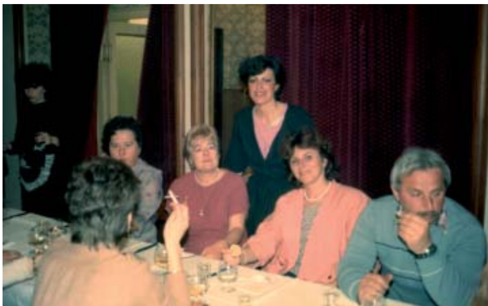
▲ Oslavy Dňa učiteľov